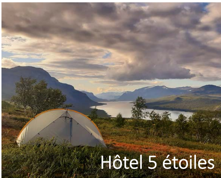
Hôtel 5 étoiles